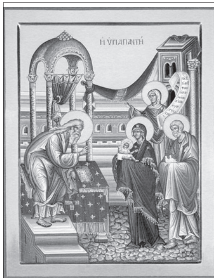
Сретение Господне. Современная икона.

15 февраля — Сретение Господа Бога и Спаса нашего Иисуса Христа.